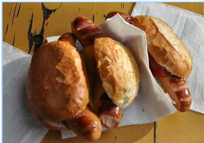
Die Rote Wurst vom Grill der Olympia-Alm war eine gefragte Ziel-Verpflegung