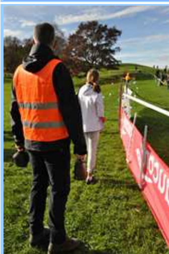
Warten auf den Sieger, der mit Kuhglocken im Ziel begrüßt wird